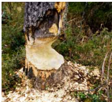
Gnagspår av bäver

Det finns många ställen utmed bäcken där man kan börja paddla eller avsluta en paddeltur då det går skogsbilvägar i närheten av bäcken längs hela sträckan.